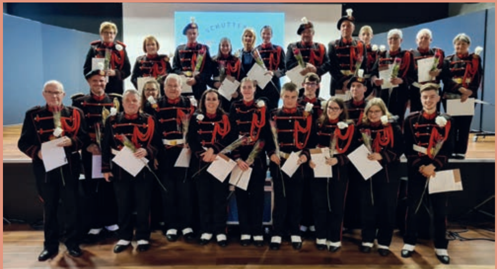
• Alle jubilarissen passen maar net op de foto.