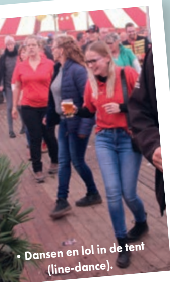
• Dansen en lol in de tent (line-dance).