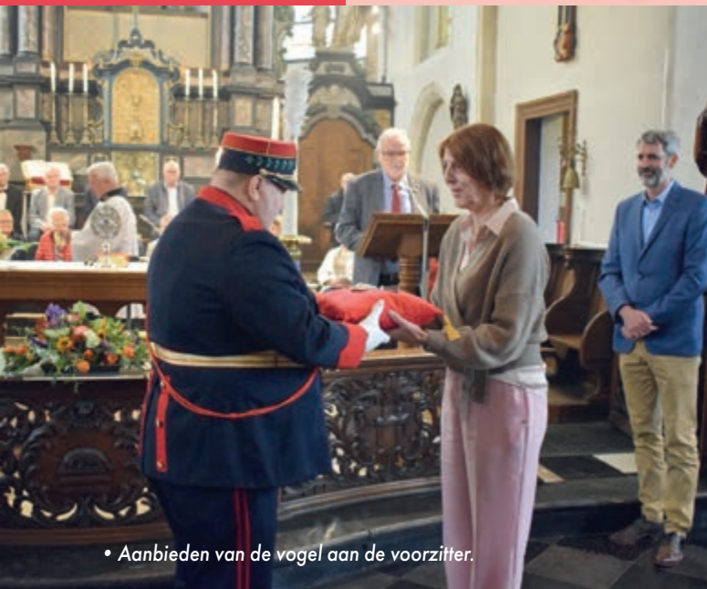
• Aanbieden van de vogel aan de voorzitter.