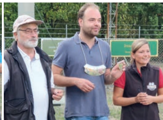
• Winnaars A-klasse.