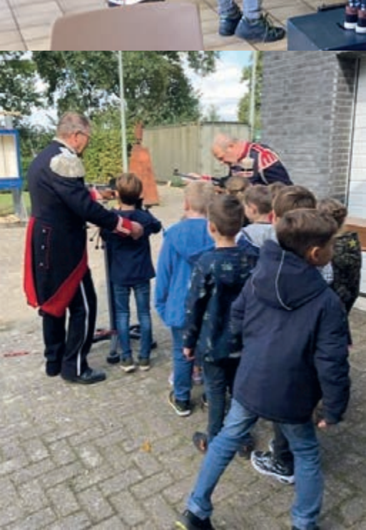
• De Grathemse schutterij liet drie klassen proeven aan het schutterswezen.

GRATHEM – Schutterij St.-Severinus Grathem kreeg begin oktober jong bezoek! 36 leerlingen van de stamgroep 3-4-5 van basisschool De Klink in Grathem waren te gast in en rond ons schutterslokaal De Gaffel. Dat bezoek paste in het onderwijsthema “Ons dorp Grathem”, waarmee de leerkrachten de jonge Grathemmers laten kennismaken met verenigingen, tradities en dergelijke binnen hun dorp.