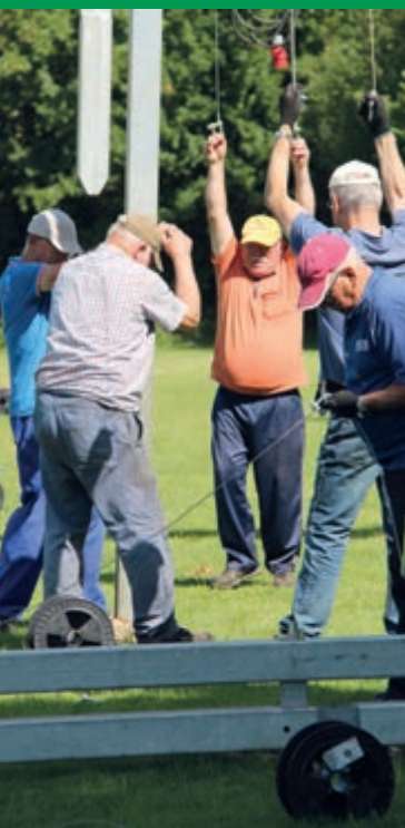
• Met vereende krachten.

Dat schutterijen op hun eigen terrein op kogelvang ers schieten is geen nieuws meer, het geldt voor verreweg de meeste verenigingen. Maar ook de bonds- en andere feesten worden steeds vaker uitgeschoten op kogelvang ers . Vroeger was dat een kostbare zaak, alleen al vanwege de hoogwerkers die moesten worden ingehuurd. De komst van eigen, door de OLS-federatie ontwikkelde mobiele kogelvang ers bood daarin een oplossing. Nu het alleen maar moeilijker wordt om 'op de vrije' te schieten, zijn de kogelvang ers dus van zeer grote betekenis voor het voortbestaan van de schutters- en schietcultuur in Limburg.