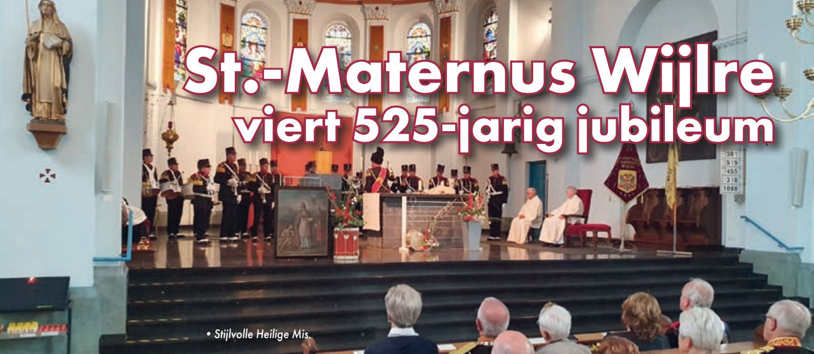
• Stijlvolle Heilige Mis.

WIJLRE – In het weekend van 26 t/m 29 augustus vierde schutterij St.-Maternus uit Wijlre haar 525-jarig bestaansfeest. Geen jubileum zonder jubilerende leden dus, behalve dat de schutterij in zijn geheel reden tot feestvieren had, werden tevens liefst 12 schutters in het zonnetje gezet. Markant en uniek was dat de 12 jubilarissen zelf eveneens 525 jaar schuttersverleden mochten vieren. De 12 jubilea waren namelijk als volgt verdeeld: 3x 60-jarig, 3x 50-jarig, 3x 40-jarig en 3x 25-jarig, een leuke toevalligheid.