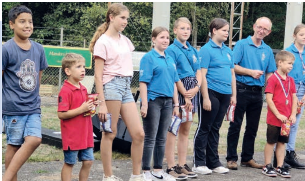
• Winnaars en deelnemers aan het jeugdschieten.