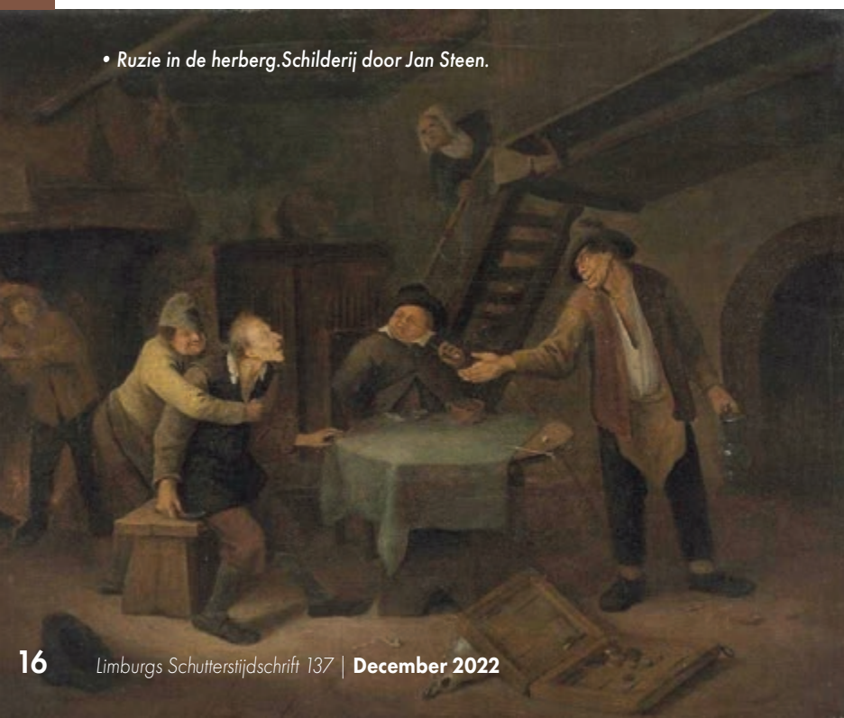
• Ruzie in de herberg. Schilderij door Jan Steen.