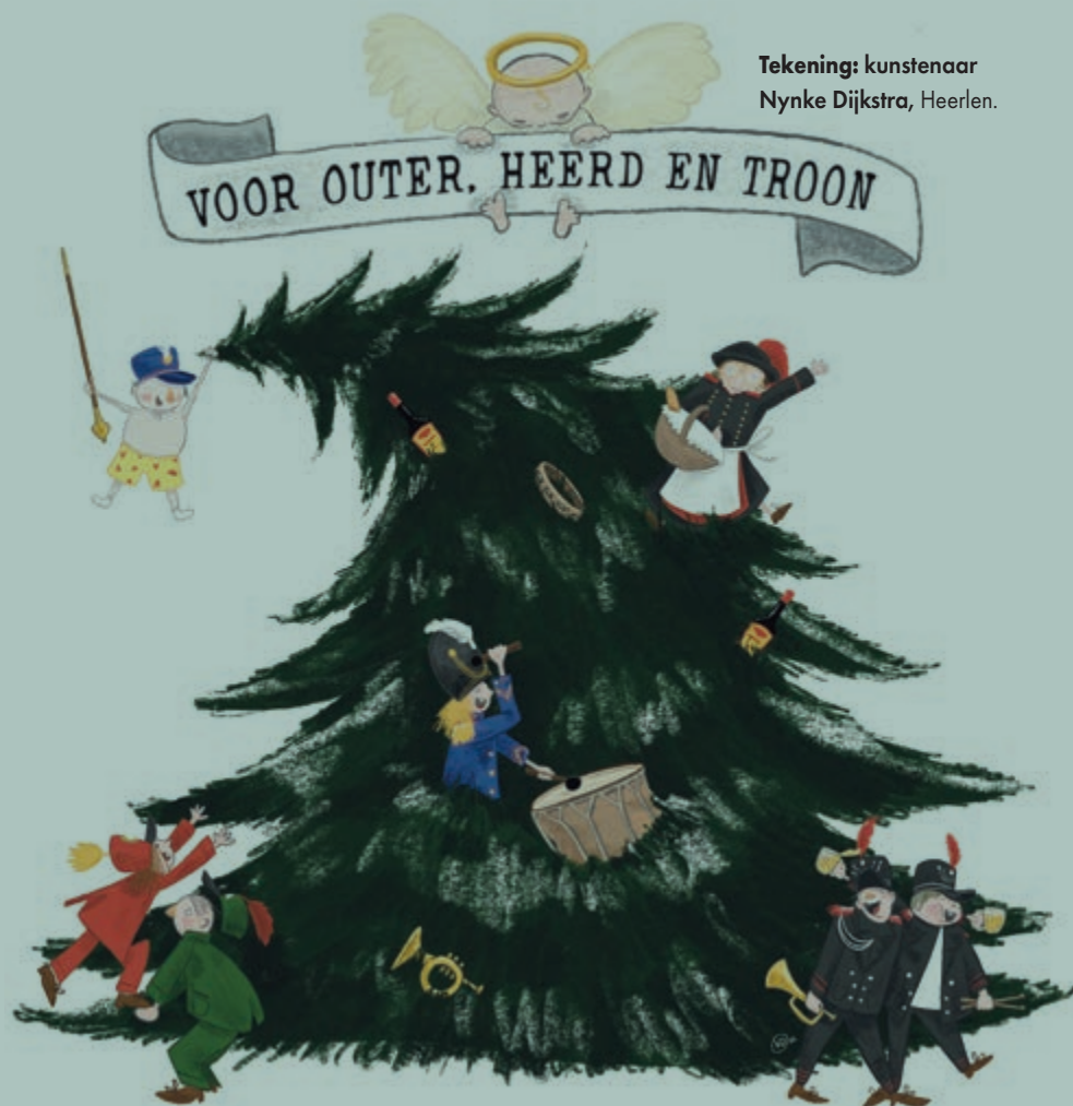
Tekening: kunstenaar Nyke Dijkstra, Heerlen.

Anoesjka gooide haar zorgvuldig voorbereide toespraak in de lucht en begon spontaan de dienbladen met glazen erewijn