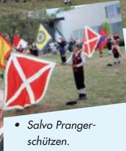
• Salvo Prangerschützen.