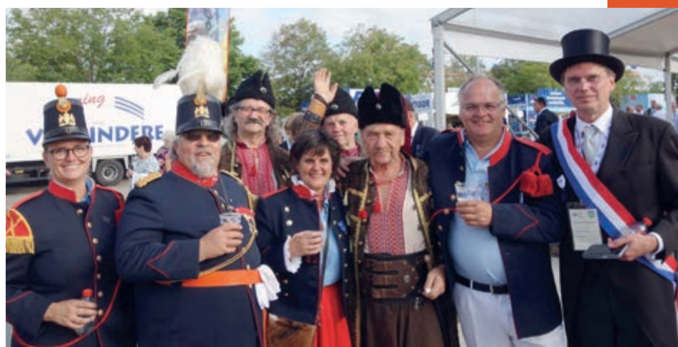
• Met Oekraïense schuttersvrienden tijdens het Europees Schutterstreffen in Deinze. Deze mannen werd een hart onder de riem gestoken door de in Oekraïense volksdracht gehulde schutterskoningin van Mheer.

Hoewel we eindelijk weer mochten, bleef het aantal schuttersfeesten voor onze vereniging beperkt. Het bondsfeest in Strucht moesten we afzeggen vanwege een sterfgeval, het bondsfeest in Mechelen werd afgelast vanwege de hitte en het ZLF werd al in een vroeg stadium uitgesteld naar 2023. Gelukkig mochten we ons wel presenteren op de feesten in onze eigen gemeente: in april tijdens het schutterspektakel in Margraten en in augustus op het bondsfeest van Berg & Dal in Noorbeek. Nu het schuttersseizoen afgelopen is, beginnen voor ons de voorbereidingen voor het jaar 2023, waarin we een heel schuttersweekend organiseren: het vogelschieten op Hemelvaartsdag 18 mei, de Dag van de Cramignon op zaterdag en op zondag 21 mei het 256e bondsfeest van de RKZLSB. Maar hierover meer in het volgende LS.