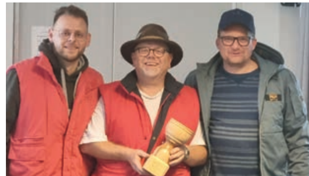
• De winnaars van de Trofee.