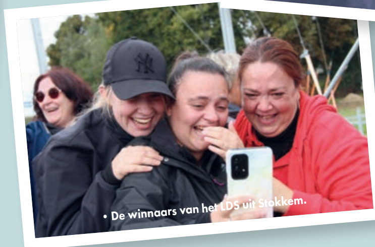
• De winnaars van het LDS uit Stokkem.