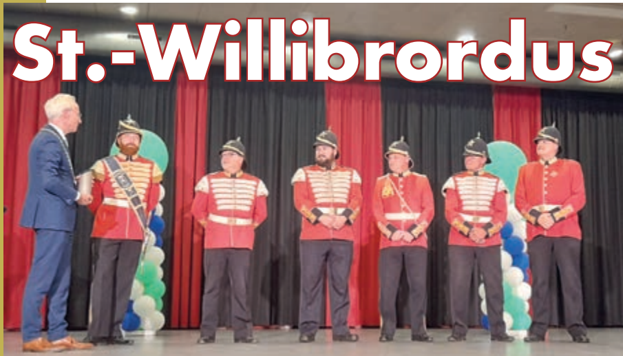
• Huldiging door de gemeente.

OBBICHT – Op 17 juli vond het laatste schuttersfeest van de bond Eendracht Born-Echt eo. plaats in Dieteren, waarmee we een geweldig seizoen konden afronden. Een jaar voor in de geschiedkundige boeken. En waar we normaal gezien als schutterij met een wat rustigere periode het najaar ingaan, was daar dit jaar niets van te merken!