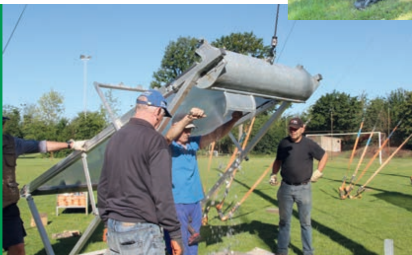
• Een rijke oogst.

Dat de vrijwilligers allemaal 'pensionada's' zijn, wil natuurlijk niet zeggen dat hun hele vrije tijd moet opgaan aan het rondkarren met en optuigen van kogelvang ers . Een uitbreiding van de vrijwilligersploeg is daarom