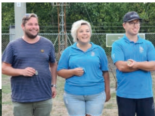
• Winnaars B-klasse.