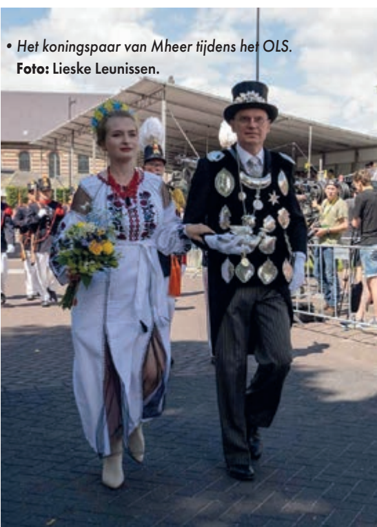
• Het koningspaar van Mheer tijdens het OLS.