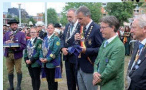
• Overdracht aan Mondsee.