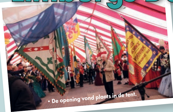
• De opening vond plaats in de tent.

NEDERWEERT – Door de Coronapandemie was St.-Antonius Nederweert, de winnaar van het LDS in het Belgische Beek in 2019, tot twee keer toe genoodzaakt de organisatie van het LDS 2020 uit te stellen.