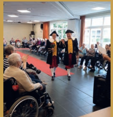
• Twee schuttersleden op de catwalk.