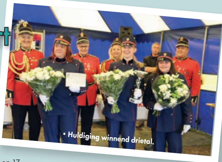
Tekst: Maurice Friedrichs

taat. Een tweede team van Stokken eindigde immers als vijfde. Na de prijsuitreiking van de tien beste damesdrietalen keerden de schutterijen en gilden huiswaarts na een geslaagd LDS 2022 in Nederweert. Op naar het volgende LDS op 17 september 2023 bij St.-Elisabeth Stokkem.