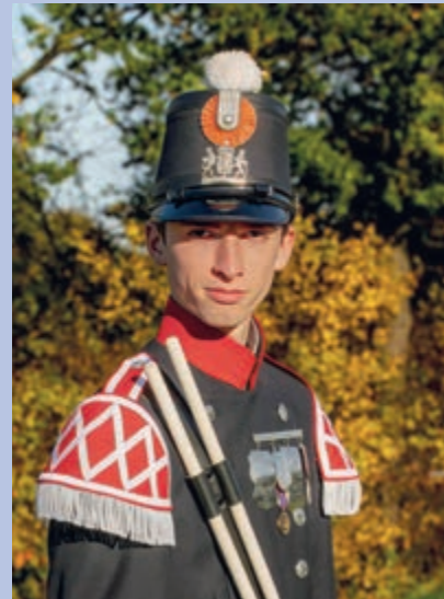
Auteur Robin Verkissen, Vaesrade.

Ondertussen in de trein hebben dennenbossen plaatsgemaakt voor mooie groene heuvels en weilanden. De warme diepe stem van Jack Poels klinkt nog steeds door m'n oortjes. Lied vur Limburg. De moeiste weg van deze wereld, leupt in t zuiden dor 'n veld. 't jonge blaad, kiek hoe