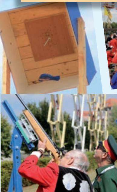
• Schietwedstrijd om het koningschap.

Het is een aanzienlijke steun uit de schutters- en gildewereld voor de schuttersverenigingen en hun bedreigde land Oekraïne, dat na de Russische inval moedig weerstand biedt.