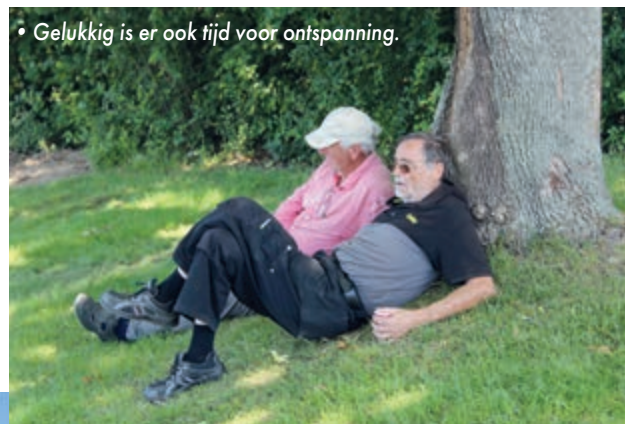
• Gelukkig is er ook tijd voor ontspanning.

We kunnen gerust stellen dat zonder kogelvang ers nauwelijks meer geschoten kan worden. De oude opstelling met hoogwerkers was misschien eenvoudiger, maar ook veel en veel kostbaarder. Willen we als schutters kunnen blijven schieten, dan is een uitbreiding van het vrijwilligerskorps niet alleen een absolute noodzaak. Het gaat om niet minder dan het in stand houden van onze Limburgse schutterijcultuur.