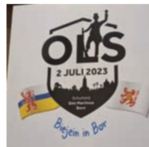
• Het nieuwe logo voor het OLS in 2023.

in de schutterswereld onderstreept. "Naast d'n Um is er nog een typisch attribuut verwerkt in het logo en wel het koningsschild", vertelt ontwerper Lars Dullens. "In het schild zijn de silhouetten verwerkt van markante Bornse gebouwen, geflankeerd door de vlaggen van Nederlands- en Belgisch-Limburg".