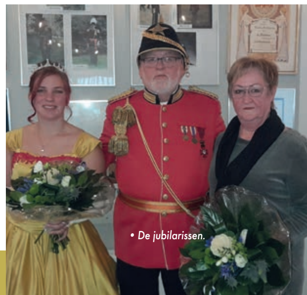
• De jubilarissen.