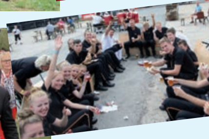
• Gezelligheid en broederschap op de feestweide.