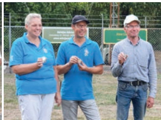
• Winnaars C-klasse.