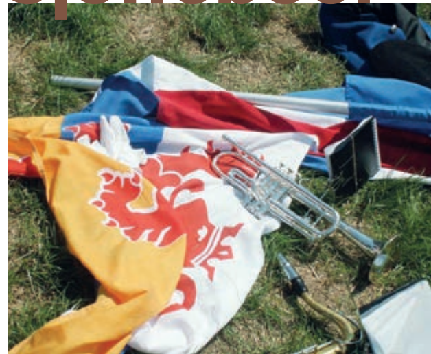
• "Ich smiet alles d'r bie neer".

Elke schutter, jong of oud, heeft in zijn omgeving wel eens een scheiding meegemaakt. Zelf, of bij familie of vrienden, bij collega's of ouders op school, de bureu. En elke scheiding verloopt weer anders: soms gaan paren als vrienden uit elkaar, soms is er een beetje gedoe, maar ook kan het helemaal uit de hand lopen. Als mensen niet meer flexibel kunnen denken, elkaar het licht niet meer in de ogen gunnen, eindigt een scheiding vaak in een vechtscheiding. De voormalige geliefden gunnen elkaar het licht in de ogen niet meer, accepteren niet dat familie of vrienden een genuanceerde houding innemen, ze willen dat je hun kant kiest en de ander afwijst en het interesseert hun niet (meer) dat de kinderen schade oplopen door de onbuigzame oorlog tussen beide ouders.