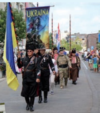
• Schuttersafvaardiging uit de Oekraïne.

Na de optocht was de officiële afsluiting met het strijken van de vlaggen. Wederom opgeluisterd door het St.-Sebastiaansgilde uit het Gelderse Gendt. Daarbij vond ook de zogenaamde Brabantse opmars met vendelholde plaats. Op plechtige wijze werd het EST overgedragen aan de organisatie van Mondsee in Oostenrijk, waar het treffen in 2024 wordt georganiseerd. Dit werd bekrachtigd met een knalhard salvo van de Prangerschützen uit Mondsee.