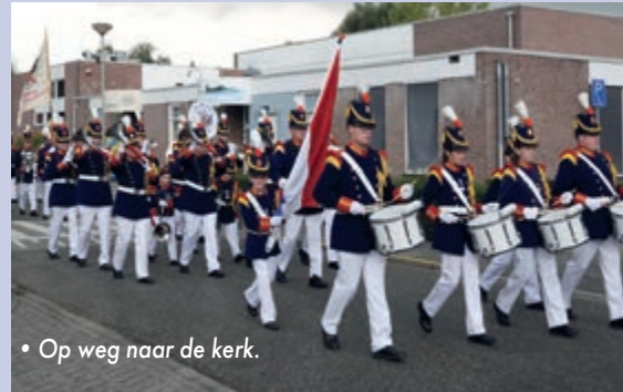
• Op weg naar de kerk.

zonnetje gezet en mochten de wisseltrofee in ontvangst nemen. Vervolgens marcheerde schutterij St.-Mauritius af naar de parochiekerk van Schin op Geul voor het bijwonen van de dankdienst. Het muziekkorps van de schutterij luisterde de H. Mis muzikaal op. De Mauritiusviering werd afgesloten met een receptie in het gemeenschapshuis, gevolgd door een gezellige feestavond. Met deze patroonsviering werd traditiegetrouw het schuttersjaar 2022 officieel afgesloten, een schuttersjaar dat voor schutterij St.-Mauritius een aantal hoogtepunten kende en dat ook inspireert om de toekomst met vertrouwen tegemoet te zien.