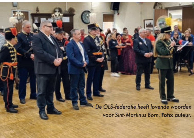
• De OLS-federatie heeft lovende woorden voor Sint-Martinus Born.