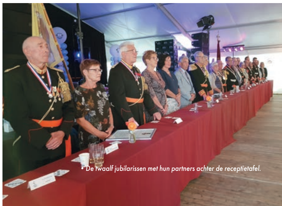
• De twaalf jubilarissen met hun partners achter de receptietafel.