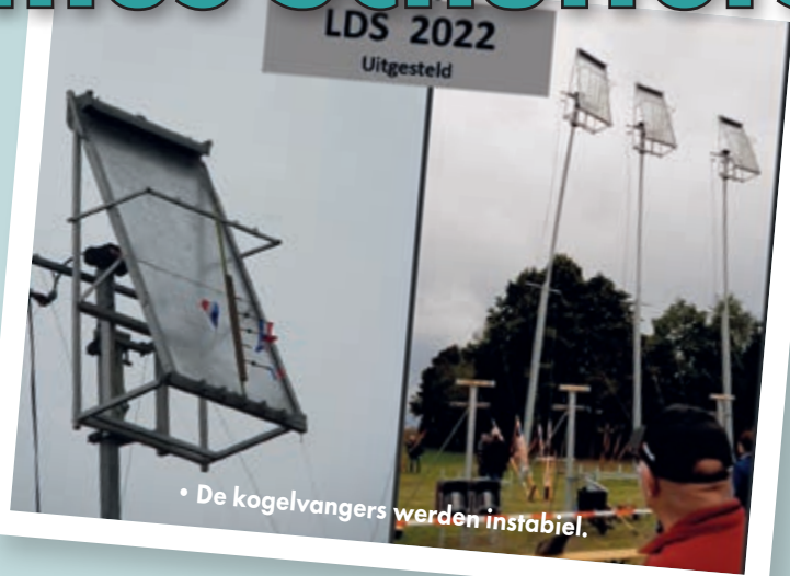
• De kogelvangers werden instabiel.

NEDERWEERT – Door de Coronapandemie was St.-Antonius Nederweert, de winnaar van het LDS in het Belgische Beek in 2019, tot twee keer toe genoodzaakt de organisatie van het LDS 2020 uit te stellen.