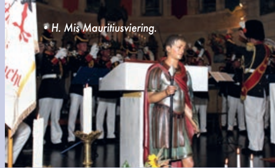
• H. Mis Mauritiusviering.