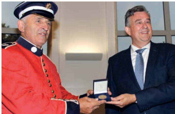
• Koninklijke penning uit handen van gouverneur Roemer.