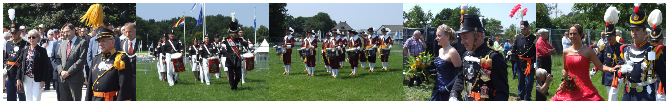
Jaargang 2017 – Editie februari 2017

□ 0031 (0) 478-51 04 00 | 0031 (0) 6 417 72 275 | olsfederatie@home.nl | www.olsfederatie.com