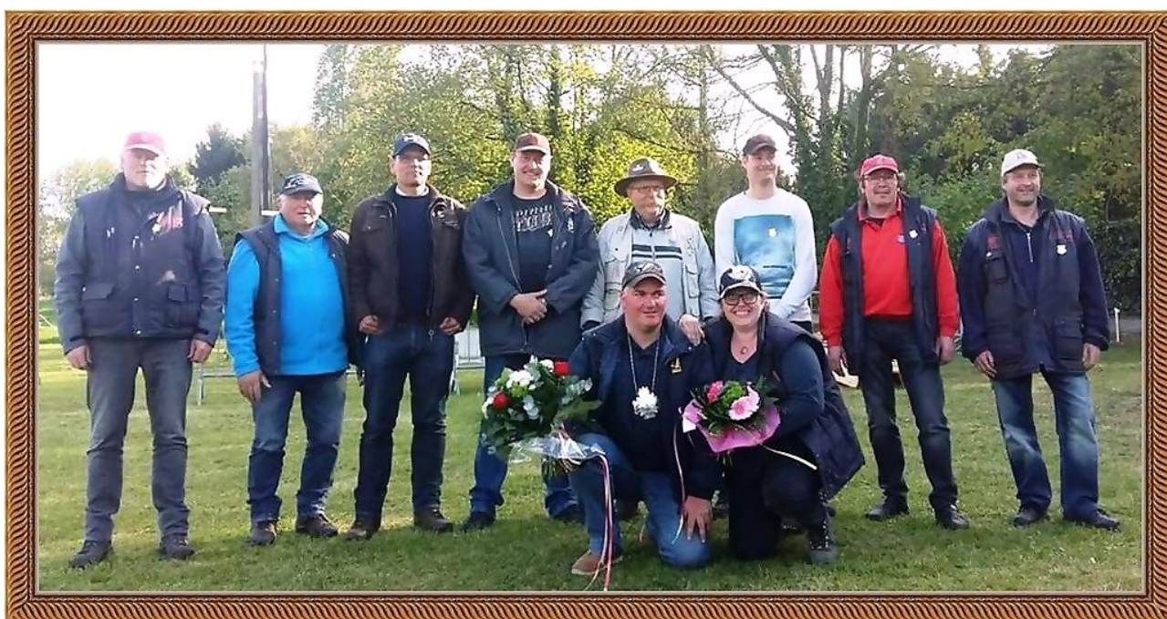
De prijswinnaars van het volwassenen persoonlijk federatiekampioenschap