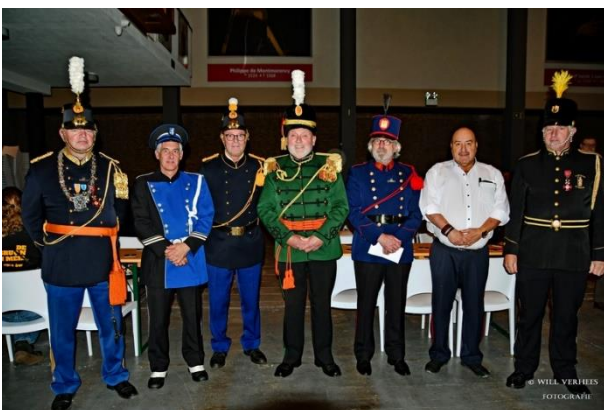
Het 125-jarig bestaansfeest van de schuttersbond EMM Weert