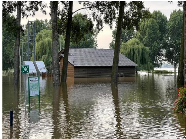
Ook het hoogwater teisterde sommige schutterijen