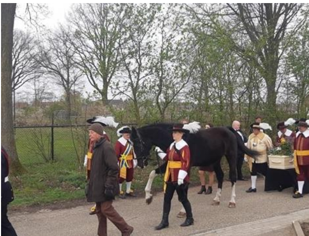
De indrukwekkende uitvaart van onze standaardruiter