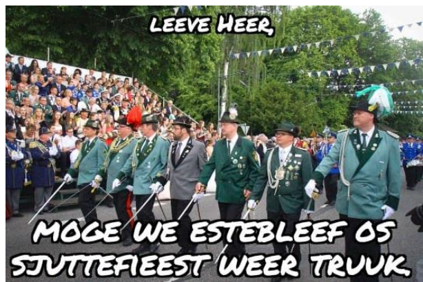
Lieve Heer, moge qw estebleef os sjuttefeest weer truuk