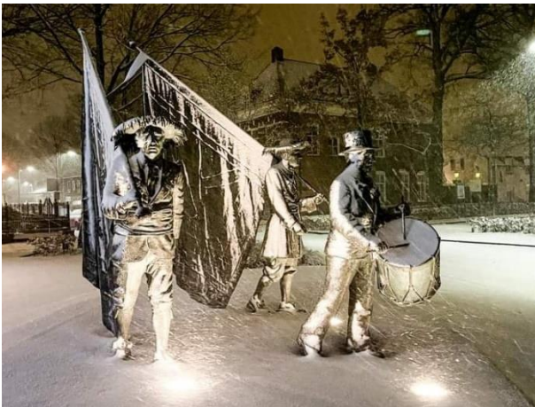
Deze foto symboliseert mogelijk hoe wij ons voelden: In de kou

Ook werden vele persoonlijk getroffen door het Corona-virus. De ene had nauwelijks klachten en de andere vocht voor zijn of haar leven. We wensen iedereen een mooie gezondheid toe, waarin wij onze grote passie: Ons schutters- en gildewezen met elkaar mogen delen.