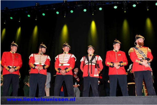
Nummer 2: Schutterij Sint Willibrordus Obbicht