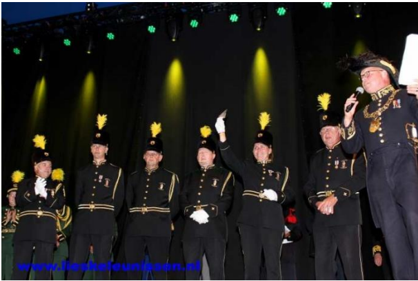
Nummer 10 Schutterij Sint Nicolaas Heythuysen