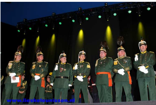
Gedeeld nummer 3: Schutterij Sint Joseph Stein