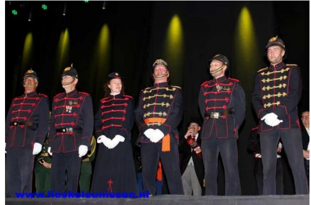
Nummer 9: Schutterij Sint Hubertus Schaesberg