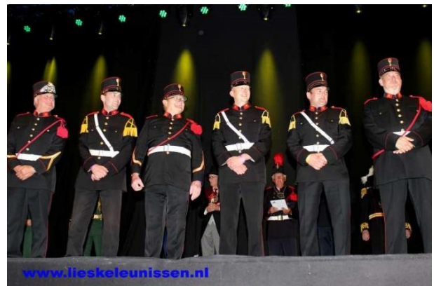
Nummer 7: Schutterij Sint Maternus Wijlre