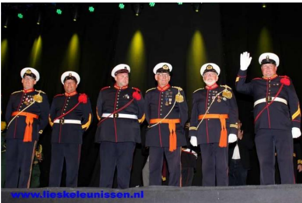
Nummer 6: Schutterij Sint Sebastianus Herkenbosch