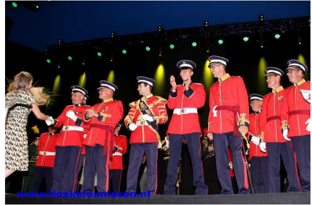
Nummer 1: Schutterij Sint Martinus Born