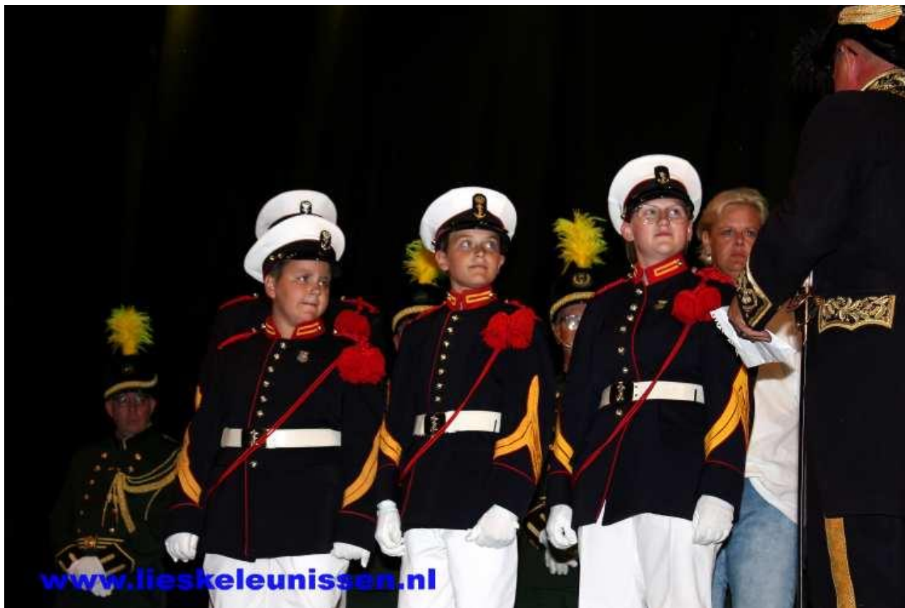
Winnaars jeugdwindbuksschieten Schutterij Sint Sebastianus Herkenbosch

Het jeugdwindbuksschieten werd voor het tweede jaar op rij gewonnen door de schutterij Sint Sebastianus uit Herkenbosch. Om de tweede plaats werd gekaveld door de jeugdschutters van Sint Sebastianus Voerendaal en Sint Joris Wessem, waarvan Voerendaal uiteindelijk de tweede plaats behaalde en Sint Joris Wessem eervol derde.