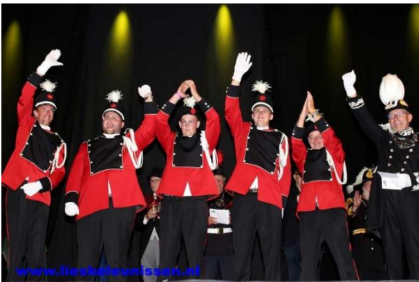
Nummer 8: Schutterij Sint Petrus Kelpen-Oler