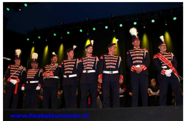
Gedeeld nummer 3: Schutterij Sint Severinus Grathem