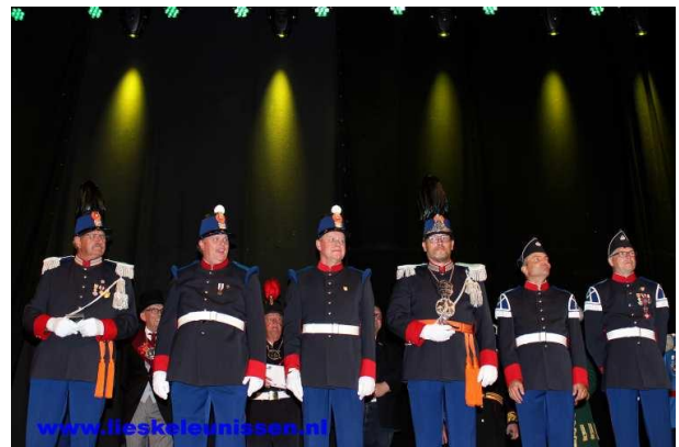
Nummer 5: Schutterij 't Zandakker Gilde Sint Jan Venray