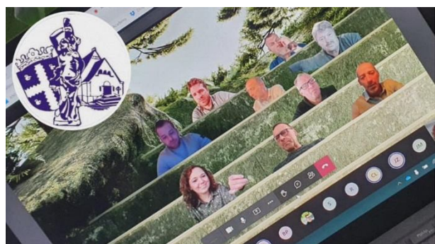
De interactieve inspiratiesessie met de schuttersbond Maas en Kempen (Links) en de digitale workshop in Margraten (rechts)