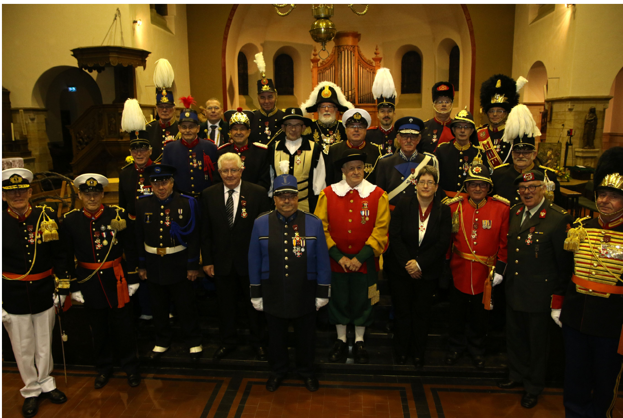
De gedecoreerden tijdens de investituur van de Rode Leeuw 2016

Zondag 24 januari 2016 vond de jaarlijkse investituur plaats van de Orde van de Rode Leeuw van Limburg en de Heilige Sebastianus. Sinds 2015 wordt deze investituur jaarlijks op een andere locatie georganiseerd en zodoende was deze keer de organisatie in handen van de schutterij Sint Laurentius uit Spaubeek, die samen met het Kapittel zorgde voor deze dag.