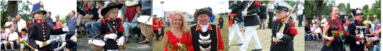
Jaargang 2020 – Editie mei 2020