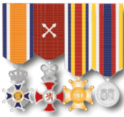
Voorbeeld miniatuur opmaak

Onderscheidingen worden over het algemeen uitgereikt in zogenaamd grootmodel. Daarnaast zijn er ook miniatures en draaginsignes. De miniatures zijn kleine versies van de grootmodel onderscheidingen en in principe bedoeld om te dragen op avondkleding (smoking/rokkostuum) of ambtskostuum. Miniatures worden net als grootmodel onderscheidingen in de juiste volgorde naast elkaar gedragen. Ook deze worden hiervoor samen aan een metalen strip bevestigd.