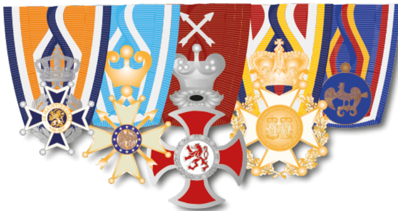
Voorbeeld NL militaire opmaak

De opgemaakte set wordt aan de achterkant voorzien van bevestigingspunten zodat de onderscheidingen als één geheel kunnen worden gedragen.