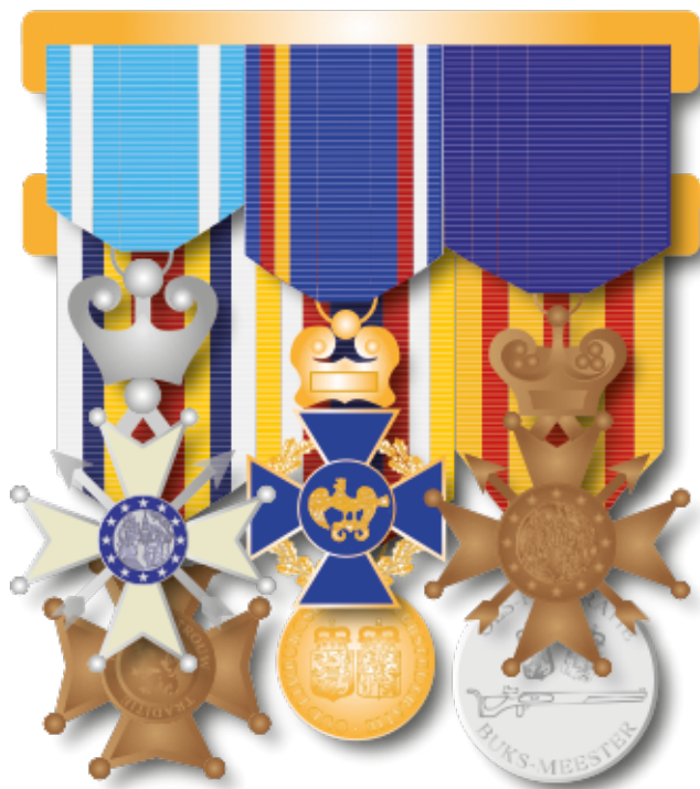
Voorbeeld B Militaire opmaak 2 lagen