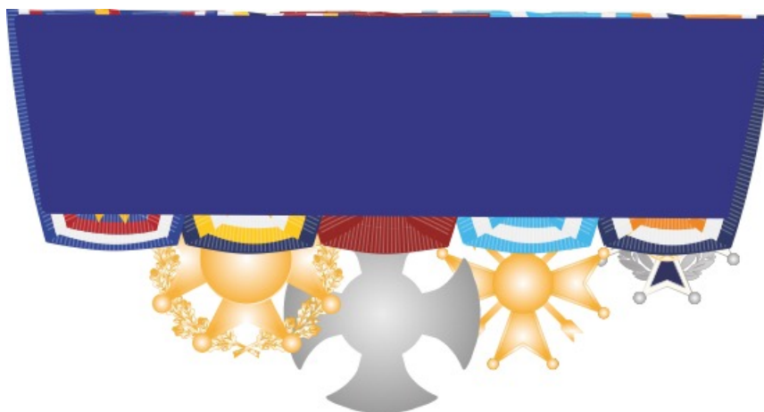
Voorbeeld achterkant met twee bevestigingspunten