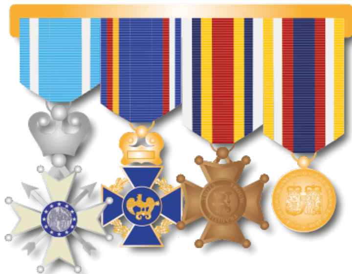
Voorbeeld B Militaire opmaak 1 laag

Volgens Belgisch militair gebruik worden de onderscheidingen hangend aan een metalen strip gedragen. De linten zijn hierbij bevestigd aan een strip zodat de medailles nagenoeg op gelijke hoogte hangen. De linten sluiten hierbij op elkaar aan. Het is niet gebruikelijk om meer dan 4 onderscheidingen naast elkaar aan een lint te bevestigen. Indien men over meer dan 4 onderscheidingen beschikt, worden deze verdeeld over meerdere sets, en worden deze onder elkaar gedragen. Bij een oneven aantal is de onderste set 1 onderscheiding smaller dan de bovenste set.